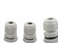
Dławnice izolacyjne M12 x1,25-2szt, M16 x 1,5- 1szt