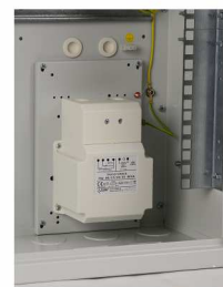
Transformatory serii TRZ...

GWARANCJA : 24 miesiące od daty sprzedaży, 36 miesięcy od daty produkcji. GWARANCJA WAŻNA tylko po okazaniu faktury sprzedaży, której dotyczy reklamacja