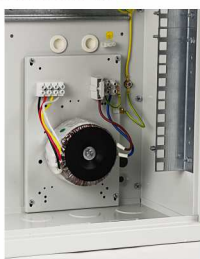
Transformatory serii TOR...