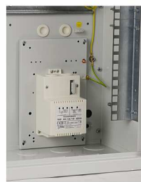
Transformatory serii TRP...