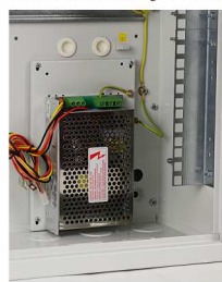
Zasilacz do zabudowy serii PS..., PSB...