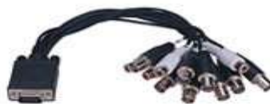
1-8 Cams Video/Audio Cable