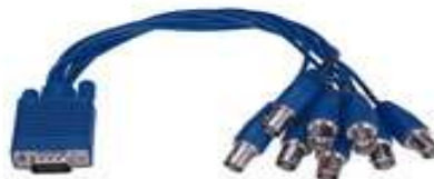
9-16 Cams Video Cable