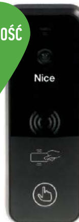
EYE PLUS B