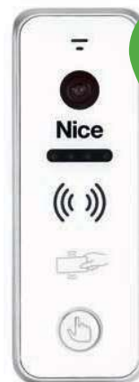
EYE PLUS W